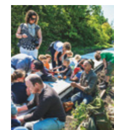
Plan van aanpak programmering Spinxkwartier